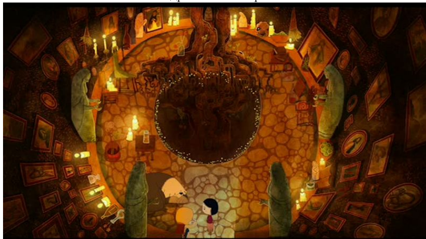
Кадр з «Пісня моря»